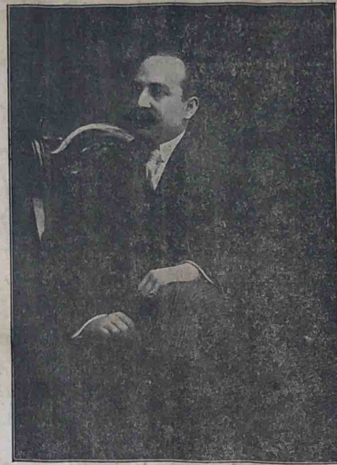
رئيس زعماء الحزب اللبناني المحافظ في فارتى اميركا الجنوبية والشمالية بمحمد موقفه تجاه اغصانه