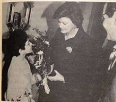
La primera dama libanesa, Sra. Mona Hraoui.