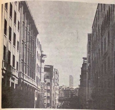
Se recuperará la grandeza de la Villa Central beirutina.