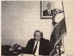
El Primer Ministro, Ómar Karame.

"asegurando la justicia social, preservando las posibilidades del sector privado y desarrollando la producción, Libano tendrá mayores posibilidades de recuperación. La conjugación de esfuerzos y un efecto sostenido en la normalización de nuestra vida y de la paz, son condiciones indispensables para la reconstrucción y el crecimiento de la economía libanesa".