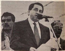
Boutros Harb Ministro de Educación.