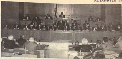
Política de estabilización del gobierno libanés.

La política de estabilización en las tazas de cambio manejadas por la Banca de Líbano desde principios de año, muestran que las operaciones sobre divisas han aumentado, sobre la base de una paridad fijada oficialmente y no por el juego de la oferta y la demanda, surgiendo la esperanza de terminar con rumores y estrategias que ciertos operadores provocan para inflar artificialmente la moneda norteamericana.