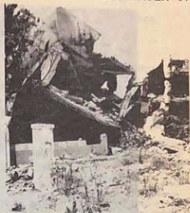
Casas y escuelas destruidas

A diario los beirutinos escuchan lo que cualquiera pensaría que es el estruendo de la guerra. No pestañean ante esto, ya que saben que, finalmente, la paz tiene un precio.