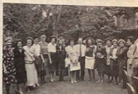
Las Damas Maronitas durante su visita al Centro Cultural Mexicano Libanés, A.C.

Así que para iniciar todo esto, que sería el medio para llevar realmente la paz a Líbano, tendrían que aplicarse medidas coercitivas para ejecutar las resoluciones 425 y 426 del Consejo de Seguridad, ya que se cumplen los requerimientos necesarios estipulados en el Capítulo VII de la Carta de la ONU. Estados Unidos, Israel y Siria deberán tomar en cuenta la seriedad de estas resoluciones y ejecutarlas escrupulosamente como se ha hecho en los casos que todos conocemos, si es que existe un verdadero interés para restablecer la paz en la región.