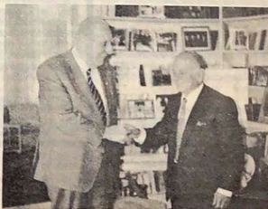
El ex-Presidente de Líbano, Prof. Charles Helou (izq.)