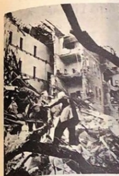
El atentado contra la Universidad Americana de Beirut, fue una muestra brutal del terrorismo contra un pueblo amante de la cultura.

Ciertos pueblos están condenados a vivir la prueba de la irracionalidad y del horror. Al nivel de su drama infinito, nosotros pensamos en el fondo de nuestros corazones que Líbano ha sido uno de ellos, todo pesimismo excluido, luchando siempre contra la fatalidad y contra los enemigos del espíritu, afrontando estóicamente los peligros, las satrapías y las injusticias que lo amenazan en forma cotidiana.