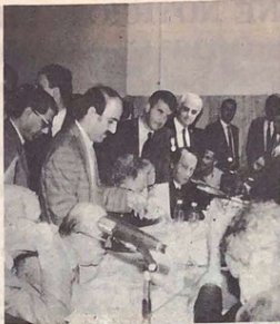
Los Representantes del Banco Mundial visitaron Beirut.